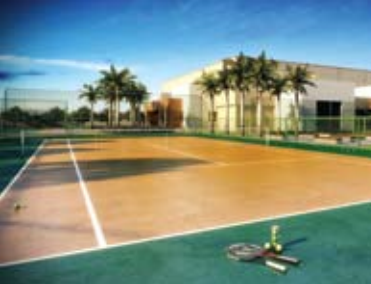
Quadras de tênis