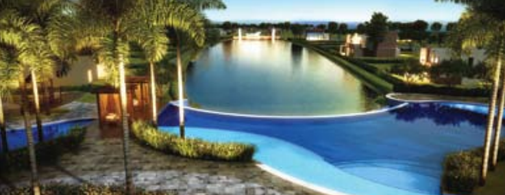
Deck do Clube das Palmeiras com piscina, lago e, ao fundo, Ponte Golden Gate II