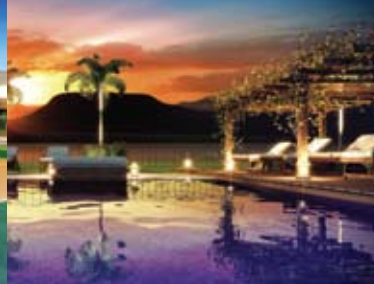
Piscina do Clube da Lagoa com vista para o pôr do sol na Lagoa dos Quadros, com a Serra do Mar ao fundo