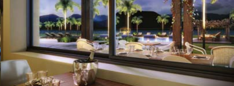
Bistrô Sol & Sal com vista externa da Lagoa dos Quadros e Serra do Mar

Natureza exuberante e infraestrutura completa para encontrar o pôr do sol mais bonito do litoral.