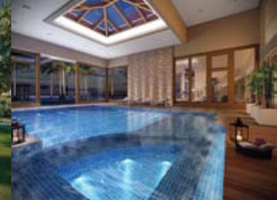
Piscina térmica interna