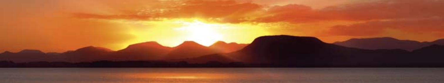
Foto obtida no local do empreendimento, na Lagoa dos Quadros.